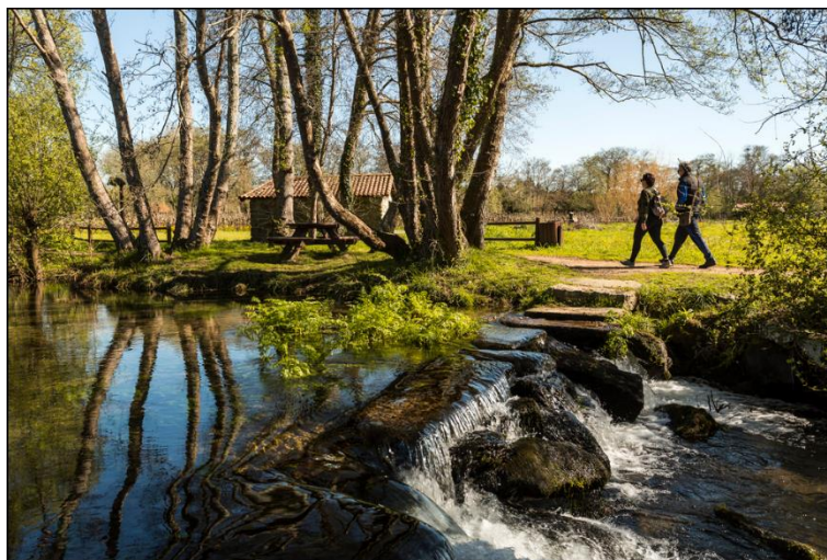
Ruta da pedra e da auga