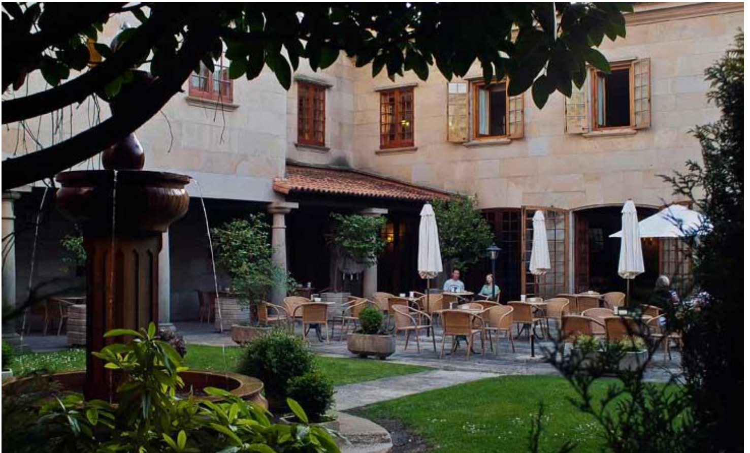
Terraza Parador de Cambados

En Fefiñáns también se encuentra el Museo Molino de Mareas A Seca, la Plaza de As Rodas, un lugar de tapeo donde abundan las tapas y el vino albariño, y la Plaza Francisco Asorey, dedicada al escultor del mismo nombre nacido en Cambados. Asimismo también hay destacadas muestras arquitectónicas de los siglos XVII y XVIII como el Pazo de Torrado, el Pazo de A Calzada, que acoge desde el 2013 la Oficina Municipal de Turismo, y el de Bazán hoy reconvertido en el Parador Nacional de Turismo de Albariño.